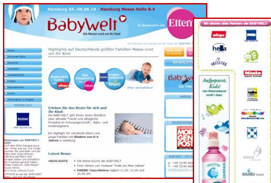
Logo-Integration als Partner: Website, Faltpan, Partner-Wand vor Ort